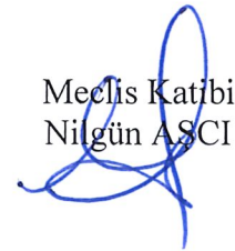
Meclis Katibi Nilgün AŞCI

Teslim Edildiği Tarih : 13 / 04 / 2022 Kayıt Numarası : 2022 / 24